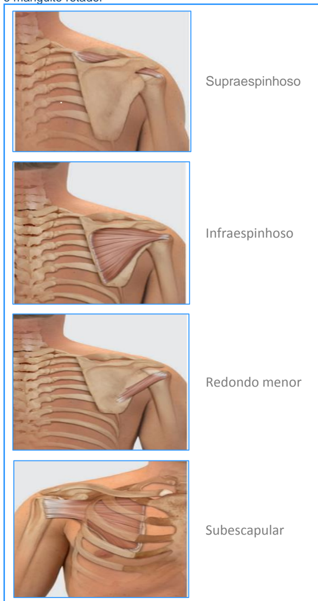
Figura 1 - Disposição anatômica dos músculos que compõem o manguito rotador

músculo supraespinhoso tem sua origem na fossa supraespinhal da escápula e inserção na faceta superior do tubérculo maior do úmero. Já o infraespinhoso tem sua origem na fossa infra-espinhal da escápula e sua inserção na faceta média do tubérculo maior do úmero. O redondo menor se origina nos dois terços da borda lateral da escápula e insere-se no tubérculo maior do úmero e a subescapular origem na fossa subescapular e se insere no tubérculo maior do úmero (17) .